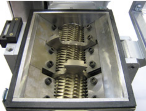
Cutting chamber Mini 2